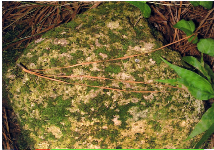
C 三鈷の松（空海伝承のお守り）