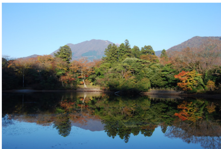
白雲の池；遠望に平成新山・普賢岳