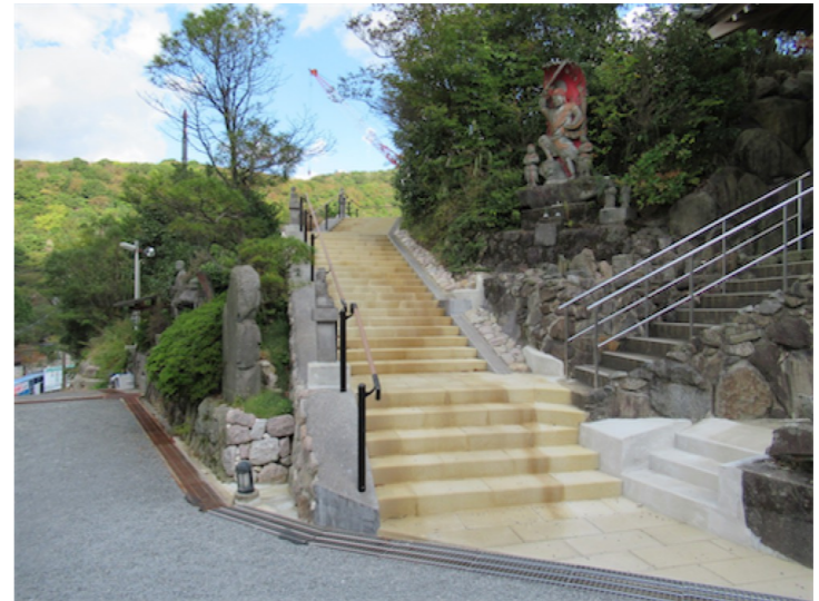
① 温泉山八十八箇所巡り入口