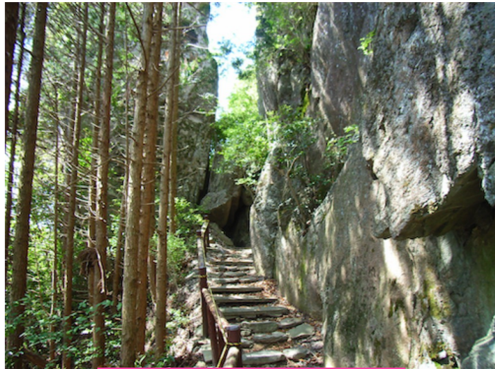
胎内潜り, 知恩堂への入口