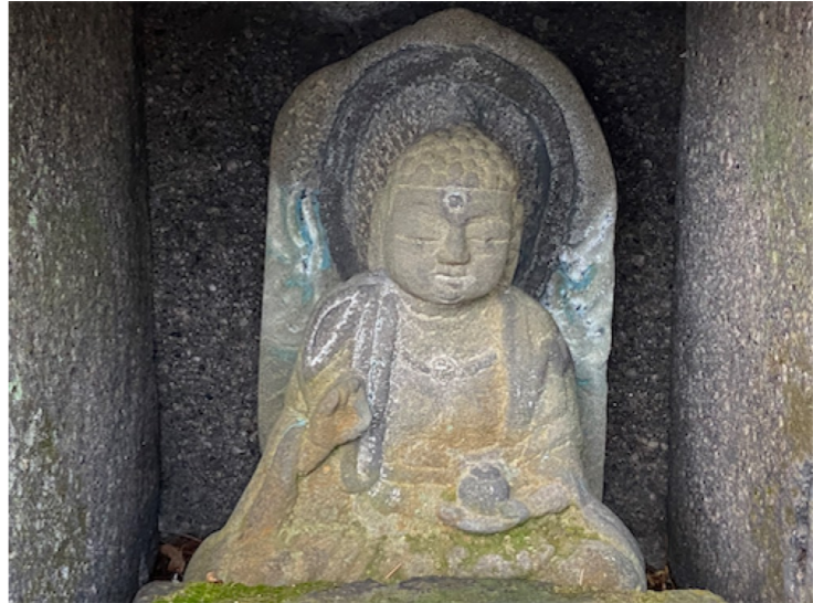
② 薬師如来座像（無病息災）