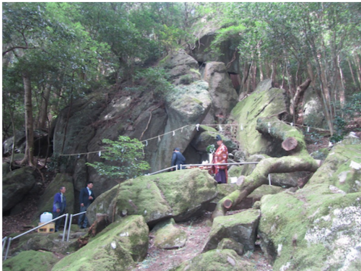
E 巨岩に彫られた大黒天磨崖仏