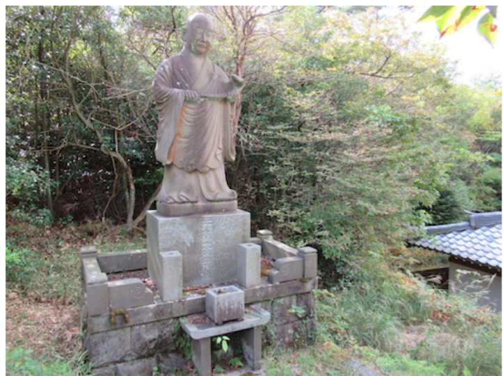
② 満明寺上公園 行基立像