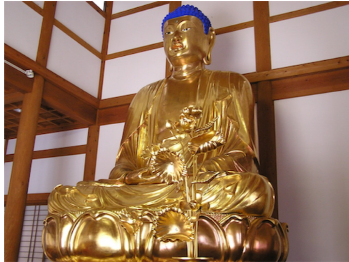
① 黄金の釈迦大仏（家内安全・無病息災）