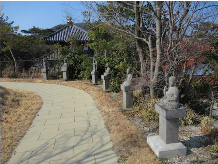
② 満明寺'上公園 温泉山八十八箇所巡り