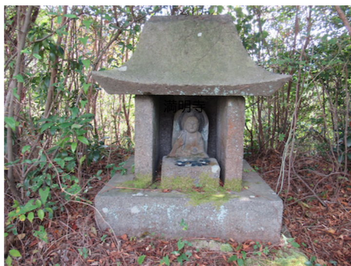
② 満明寺上公園 薬師如来座像（無病息災）