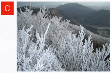
冬の霧氷; 12月～2月の寒冷の日