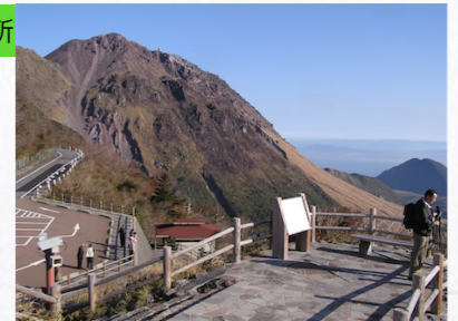
第二展望所から、平成新山を望む