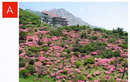
春のミヤマキリシマ; 5月中旬